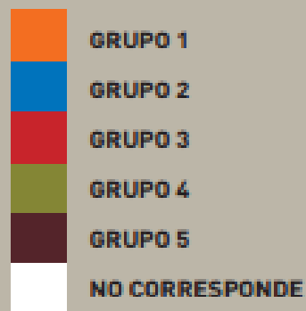
Mapa 1.1.1. Países de América Latina, según su ubicación en la tipología propuesta para el análisis