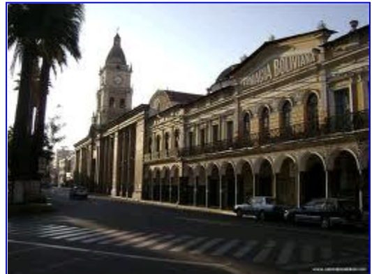
Catedral de Cochabamba

Otros atractivos turísticos en la ciudad de Cochabamba son: